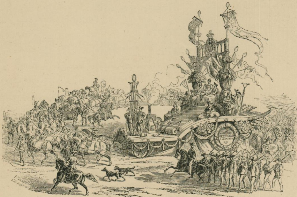
Char de Nivelles.

CAVALCADE ORGANISÉE A L'OCCASION DU XXV e ANNIVERSAIRE DE LÉOPOLD I er .